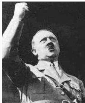
Galen av droger?

Efter varje injektion kunde Hitler arbeta och tala i timmar, oftast långt in på nätterna. Drogerna ledde förmodligen även till de ändlösa monologerna vid matbordet med sina närmaste män. Många teorier har framförts angående dessa ändlösa och ibland hysteriska tal. Även hans tal till befolkningen har varit ett mysterium för många. Hur kunde han "elda upp" en hel befolkning till den grad som skedde. Sanningen är nog att när Hitler "eldade upp" den tyska befolkningen med sina offentliga tal var han själv "uppeldad" av amfetamin. Hitler kunde annars knappast ta sig ur sängen utan att ha fått en amfetamininjektion.